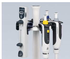
Der Regalhalter passt in den Tischständer für Transferpette® S.