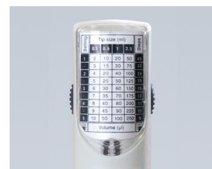
Schnelle Volumeneinstellung mit der Tabelle zu den Hubeinstellungen