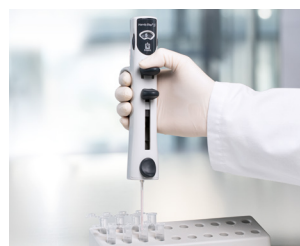
Dispensieren kleiner Volumina